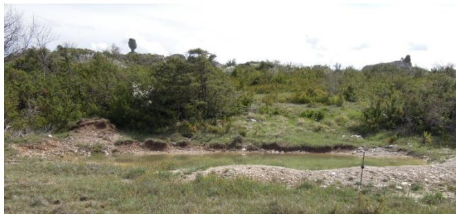
Lavogne du Fraissinel (mas cité dans les chartes Templières du XII e) En fond le rocher pédonculaire « la naine »