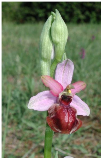
Ophrys de l'Aveyron