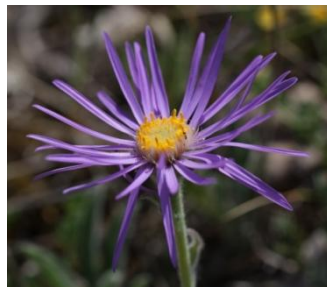
Aster des Alpes