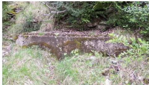
Au pied des falaises, le captage de la source de Font Platelle (hors parcours fléché)