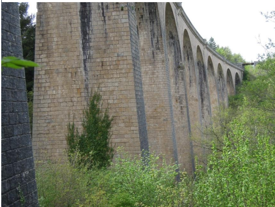
Viaduc de Lapanouse, 11 arches, 218 m de long

En espérant que ce topoguide vous a permis de découvrir et d'apprécier nos merveilleux paysages, notre flore exceptionnelle, notre faune unique et notre histoire remarquable.