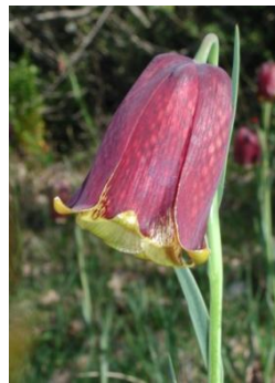
Fritillaire des Pyrénées