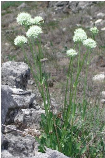
Saponaire à feuille de pâquerette