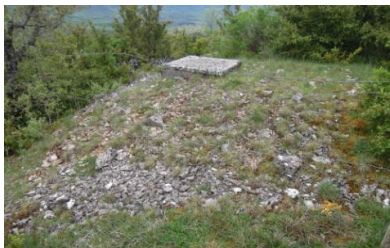
Le château d'eau au dessus des abreuvoirs

L'eau, c'est la richesse de la devèze de Lapanouse.