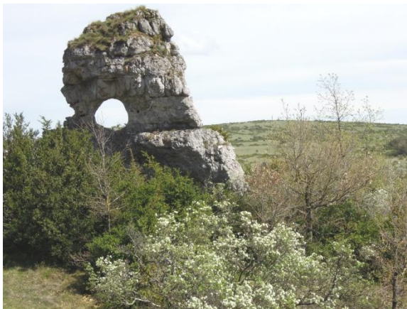
Le roc de la lune, appelé la borne traoucade au XVI e siècle